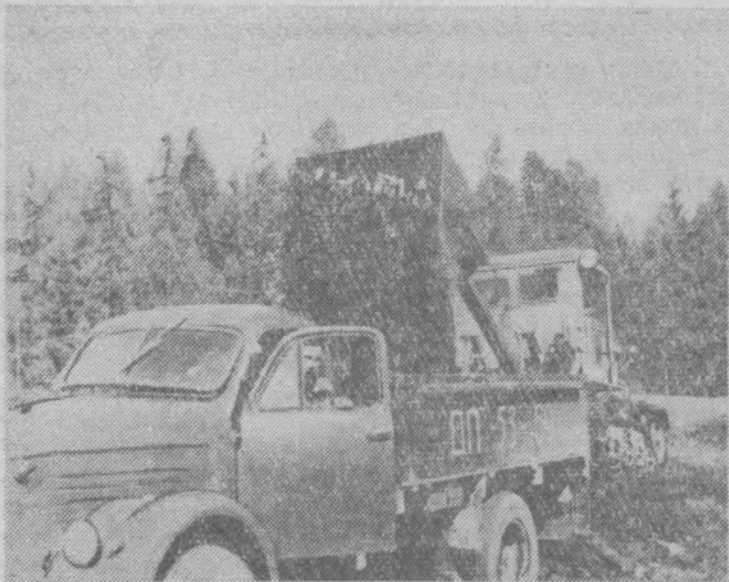
Заготовка и вывозка торфа на поля в колхозе «Герой труда».