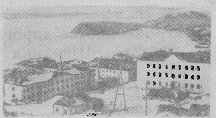
КАМЧАТСКАЯ ОБЛАСТЬ. Новые поселки строятся для моряков и портювиков, рыбаков и судоремонтников города Петропавловск-Камчатский.