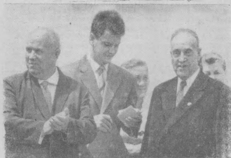
Пребывание Председателя Совета Министров СССР Н. С. Хрущева в Вене. Н. С. Хрущев приветствует жителей Вены. Справа — Президент Австрийской Республики А. Шерф. (Снимок принят по фототелеграфу).

Участники поездки во главе с Н. С. Хрущевым и Федеральным канцлером Ю. Раабом поднимаются по каменным ступеням концлагеря,