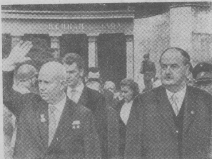
Пребывание Председателя Совета Министров СССР Н. С. Хрущева в Вене. На снимке: Н. С. Хрущев и Федеральный канцлер Ю. Рааб на площади Шварценбергплац у памятника советским воинам, павшим в борьбе за освобождение Австрии от гитлеровских захватчиков. (Снимок принят по фототелеграфу).

После короткого ознакомления с институтом животноводства гости вышли во двор, где им был приготовлен сюрприз. Н. С. Хрущеву были переданы в дар два племенных бычка. К вечеру Н. С. Хрущев и сопровождающие его лица прибыли в охотничий замок Фушль, расположенный в окрестностях города Зальцбурга. Отсюда они после короткого отдыха отправились в Зальцбург.