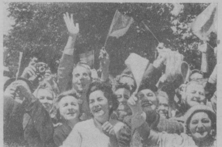
Пребывание Председателя Совета Министров СССР Н. С. Хрущева в Вене.

На снимке: жители Вены приветствуют Н. С. Хрущева.