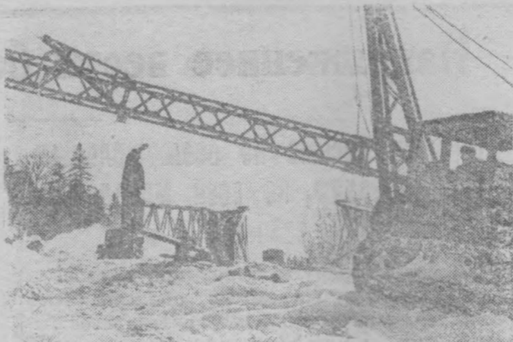
Приморский край. Через тайгу, хребты Сихотэ-Алиня и горные реки прокладывают линию электропередачи монтажники Приморского участка управления «Дальэнерго». Новая линия рассчитана для передачи тока напряжением 220 тысяч вольт на расстояние 355 километров от Суванской ГРЭС до поселка Горелое Тетюхинского района. Она будет питать электроэнергией полиметаллический комбинат «Сихали» и Хрустальненский горнообогатительный комбинат.