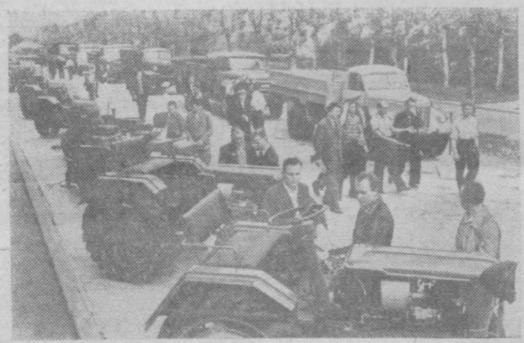
Москва. В эти дни ВДНХ посещает много экскурсантов.

На снимке: на открытой площадке павильона «Машиностроение». Посетители осматривают новые модели тракторов.