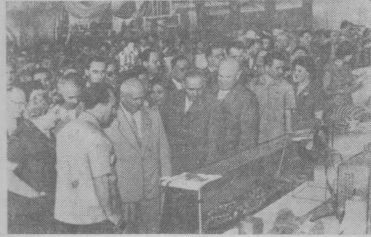
Румынская Народная Республика. В Бухаресте состоялось торжественное открытие советской выставки. На снимке: в одном из залов выставки.

—Что в клуб тебя тянет, никак не пойму? —Да мне захотелось побыть одному.