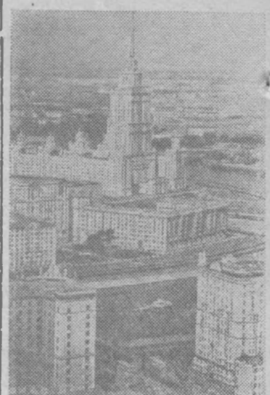
Москва сегодня. Вид на высотное здание гостиницы «Украина» и новые жилые дома.

Пижемский леспромхоз, Арбинский лесозаготовительный участок.