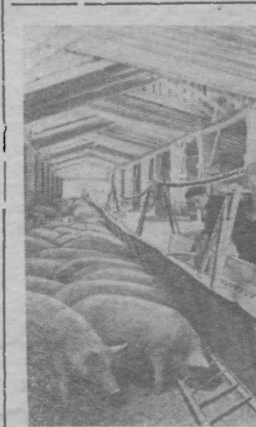
Татарская АССР. На снимке: в механизированном свинокормочном цехе совхоза «Сокольский».

В. ДАВЫДОВ. Ученый секретарь Государственного астрономического института имени Штернберга.