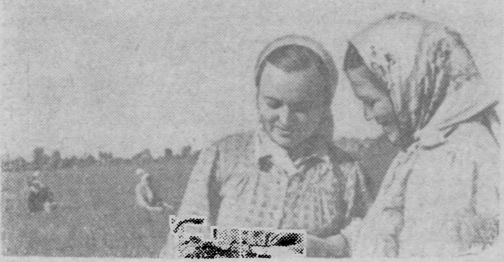
РОВЕНСКАЯ ОБЛАСТЬ. Колхозники сельхозартели им. Калинина Сарненского района в сжатые сроки провели сев, обработали поля ядохимикатами для защиты от льняной блошки. Ведут прополку посевов.

Товарищи колхозники и механизаторы, обеспечим хороший уход за посевами, создадим условия для получения высокого урожая всех сельскохозяйственных культур!