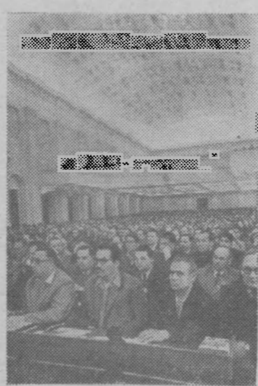
Москва. В Большом Кремлевском дворце состоялось Всесоюзное совещание по градостроительству.

За декаду поступило от колхозов мяса более 25 тонн.