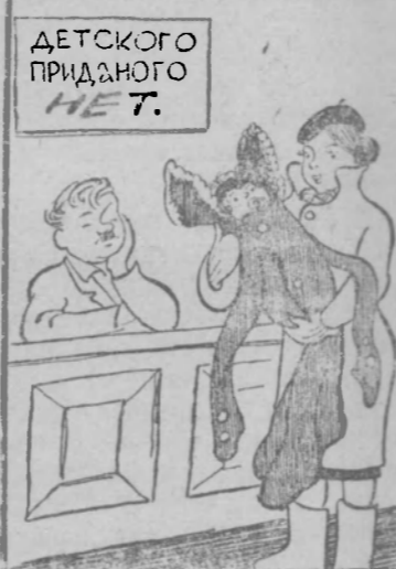
В отцовском наряде.