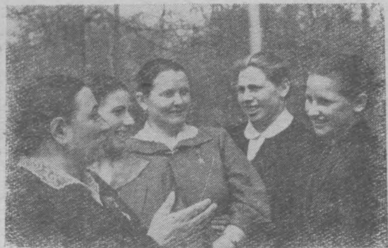
Рязанская область. Животноводы Рязанщины взяли обязательство надонить в 1960 году в среднем не менее 3.200 килограммов молока от коровы.

Чтобы достигнуть такого результата, колхозники переводят скот на летнее лагерное содержание с применением «зеленого конвейера». Сейчас ведутся работы по улучшению лугов и пастбищ.