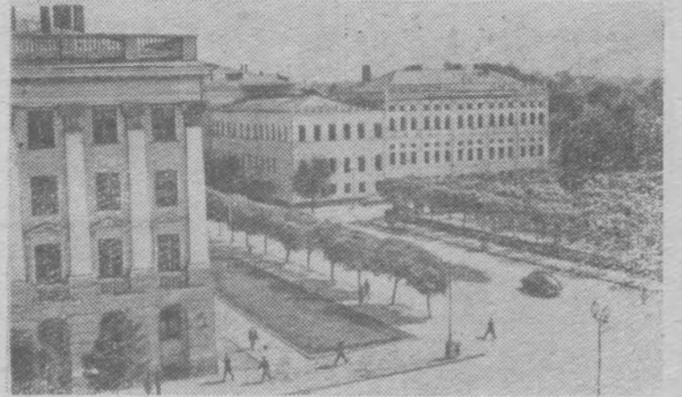
Казань. Слева — корпус химического факультета Казанского государственного университета имени В. И. Ульянова-Ленина, справа — здание Академии наук СССР (Казанский филиал).