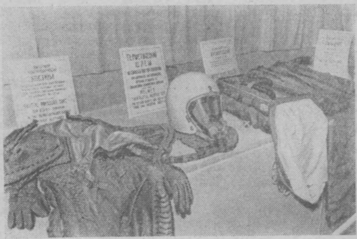
В Центральном парке культуры и отдыха в Москве устроена выставка вещественных и документальных доказательств вторжения на территорию СССР 1 мая 1960 года американского самолета.

На снимке: высотный компенсаторный костюм, герметический шлем, парашютный кислородный прибор и спасательный парашют американского летчика.