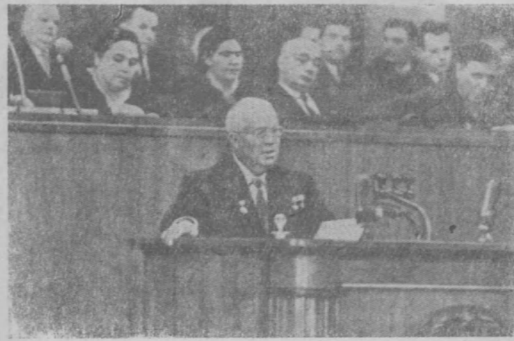
Москва. 5 мая в Большом Кремлевском дворце открылась пятая сессия Верховного Совета СССР пятого созыва.

Под знаменем Ленина, под руководством Коммунистической партии к новым победам в строительстве коммунизма! Доклад Н. С. Хрущева неоднократно прерывался бурными аплодисментами. (ТАСС).