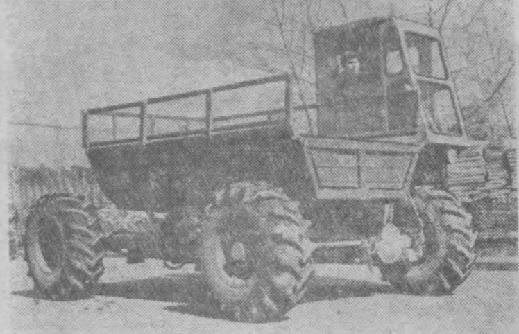
На Тульском комбайновом заводе освоен выпуск самоходных шасси.

На снимке: члены бригады, обслуживающей доменную печь 5 металлургического комбината Сталинграда. Эта бригада — одна из передовых на комбинате.