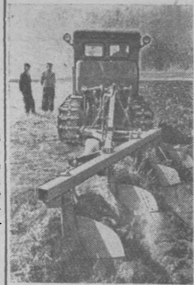
Развернулись полевые работы в колхозах Куйбышевской области.

На снимке: вспашка участка трактором «Т-54А» с навесным плугом «ПН-4-35» «Пахарь».