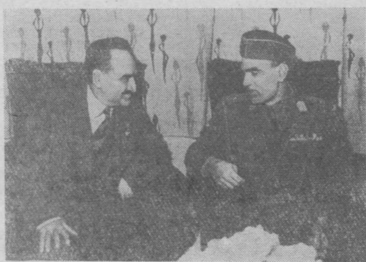
Пребывание А. И. Микояна в Иракской Республике. На снимке: А. И. Микоян и Абдель Керим Касем во время беседы. (Снимок принят по фототелеграфу).

В заключение своей речи А. И. Микоян провозгласил здравницу в честь советско-иракской дружбы. (ТАСС).