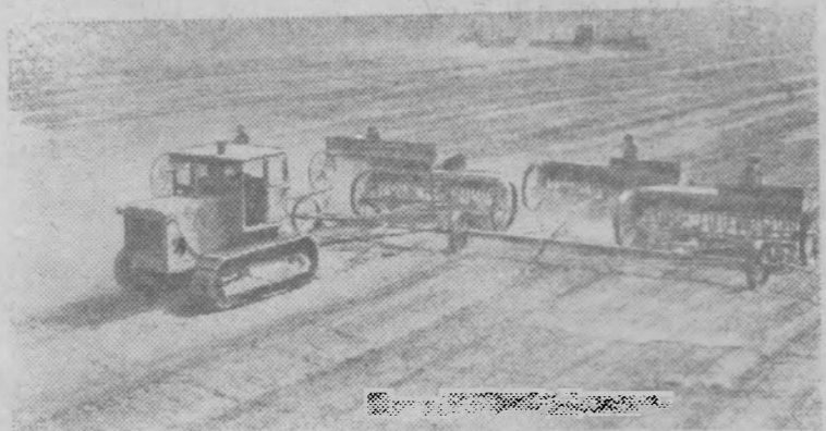
Ставропольский край. Колхозы и совхозы включились в сев зерновых культур. Успешно ведут посевную механизаторы передового в крае Темижбекского зерносовхоза. За два дня засеяно 82 процента всей площади колосовых. На снимке: сев колосовых на полях совхоза «Темижбекский».