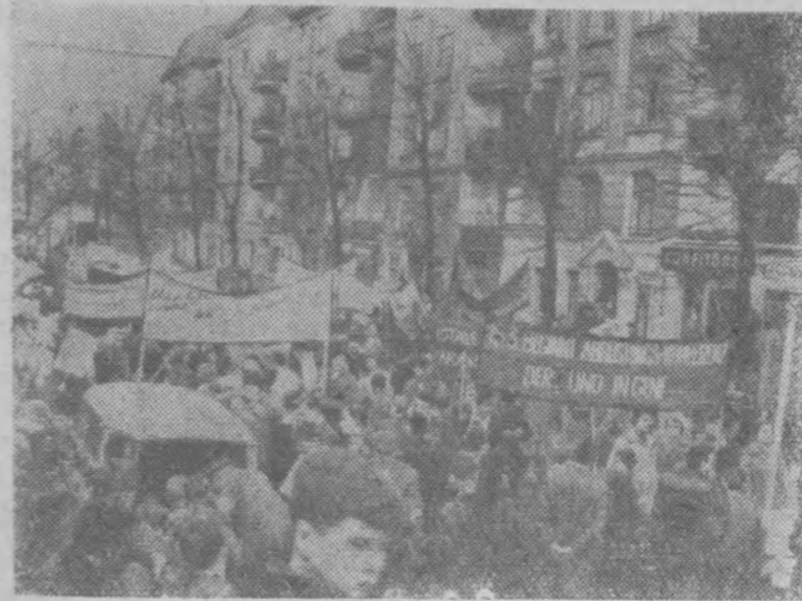
Федеративная Республика Германия. В Гамбурге состоялась демонстрация против атомного вооружения Западной Германии и за запрещение испытаний ядерного оружия. Сотни демонстрантов прошли по улицам города с плакатами, на которых было написано: «Всеобщее разоружение гарантирует мир!», «Помни о Хиросиме!», «Долой атомные базы в Испании!». На снимке: демонстрация в Гамбурге.