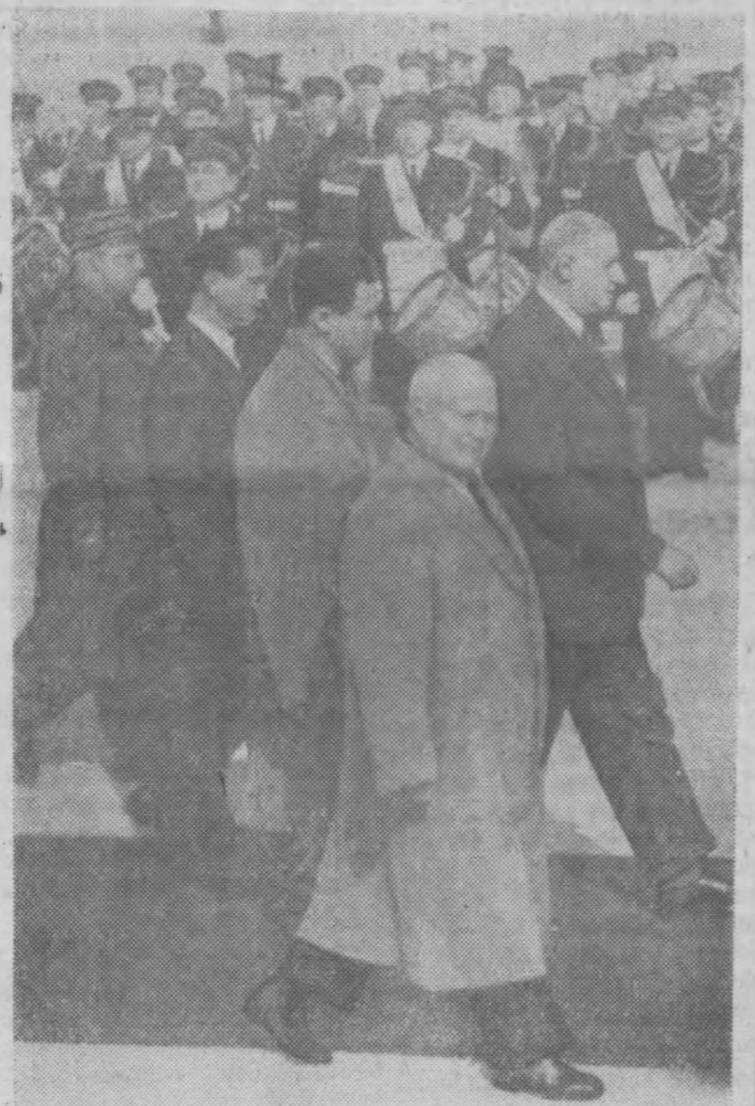
Прибытие во Францию с государственным визитом Председателя Совета Министров СССР Н. С. Хрущева.

На снимке: Н. С. Хрущев и Президент Ш. де Голль во время торжественной встречи на парижском аэродроме Орли.