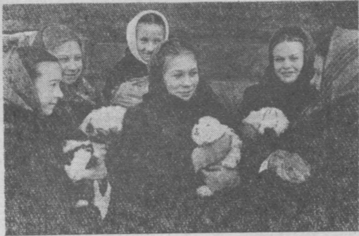
Вот они, юные кролиководы.