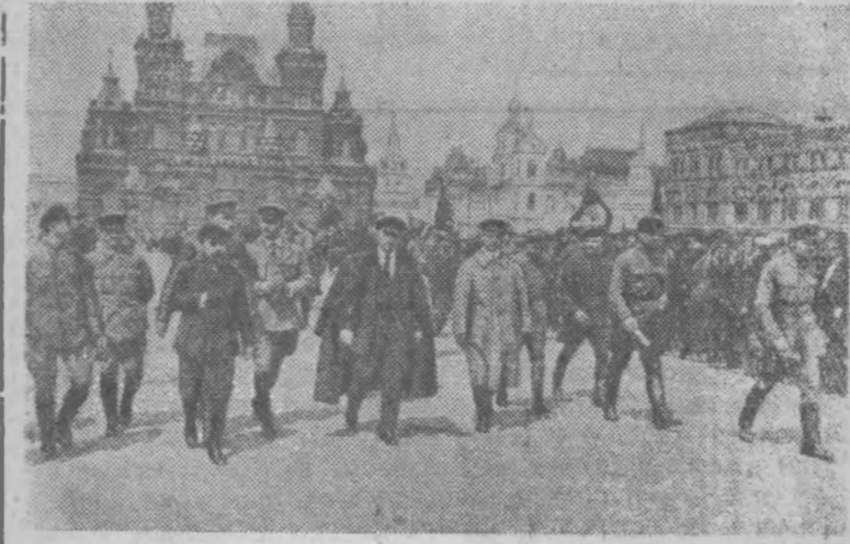
В. И. Ленин обходит фронт войск Всеобуча на Красной площади 25 мая 1919 года.

водит ценностей больше, чем прежде пятеро. Труд стал человеку не в тягость, а в радость.