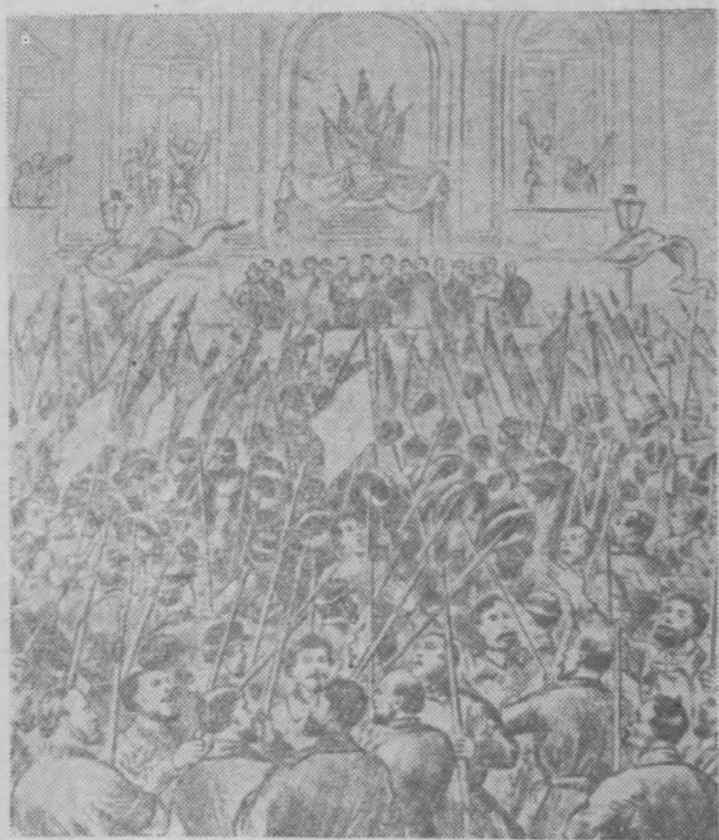
Провозглашение Коммуны перед зданием ратуши. (Иллюстрация из журнала 70-х годов XIX века).

18 марта 1960 года трудящиеся мира широко отметили 89 годовщину Парижской Коммуны