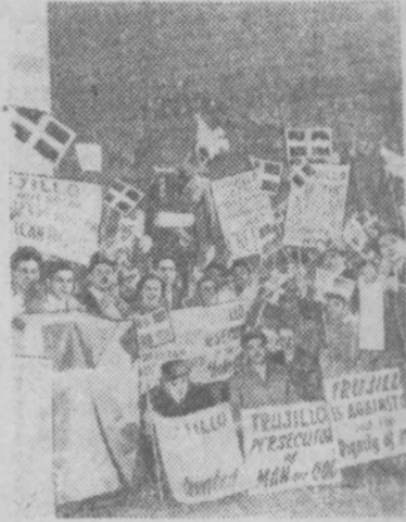
США. Доминиканцы-эмигранты, живущие в Нью-Йорке, устроили недавно демонстрацию протеста против Трухильо, осуществляющего в Доминиканской Республике антинародную военную диктатуру. На снимке: группа демонстрантов у здания Организации Объединенных Наций.