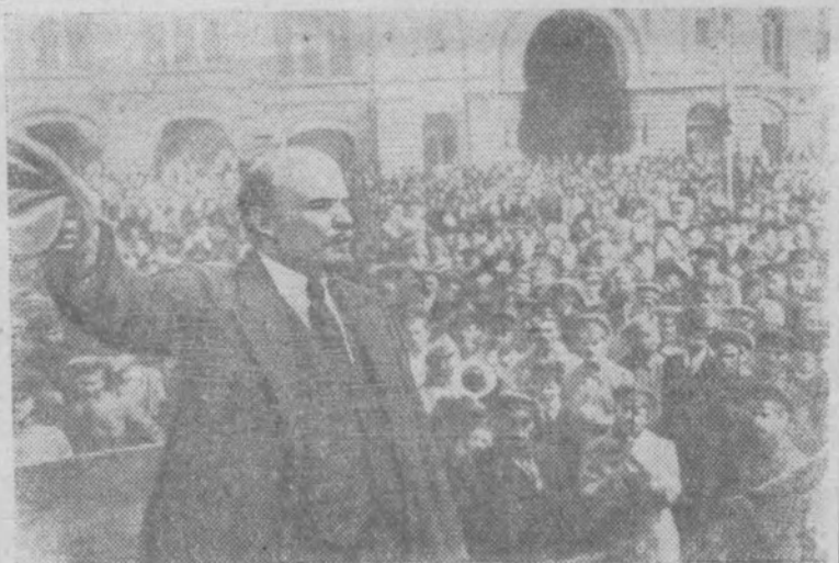
В. И. Ленин произносит речь на Красной площади в Москве. Май 1919 г.