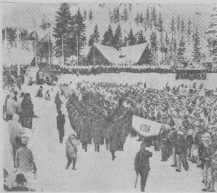
США. Сяво Валли. Советская команда на торжественной церемонии открытия VIII зимних олимпийских игр.