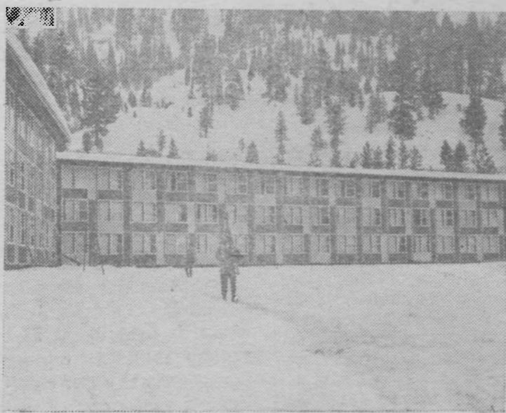
К предстоящим зимним Олимпийским играм в Скво Вэлли (США).

На снимке: помещения для участников Олимпийских игр.