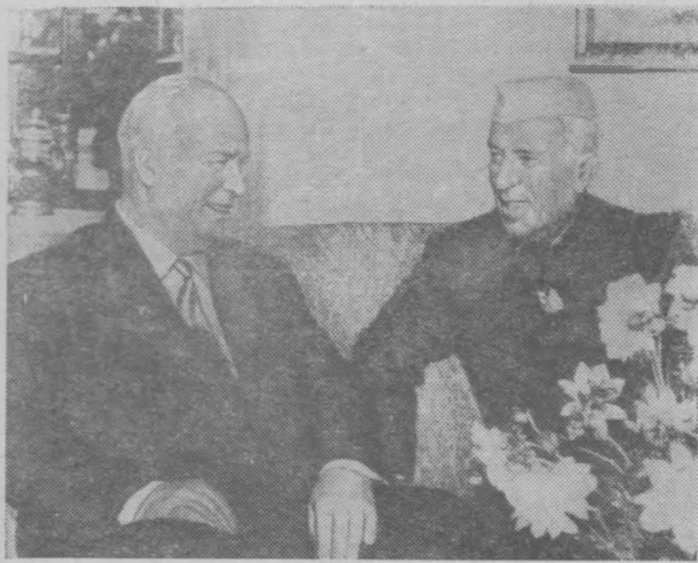
ДЕЛИ. Председатель Совета Министров СССР Н. С. Хрущев нанес визит премьер-министру Республики Индии Джавахарлалу Неру. Встреча пошла в дружеской, теплой обстановке. На снимке: во время беседы. (Снимок принят по фототелеграфу).