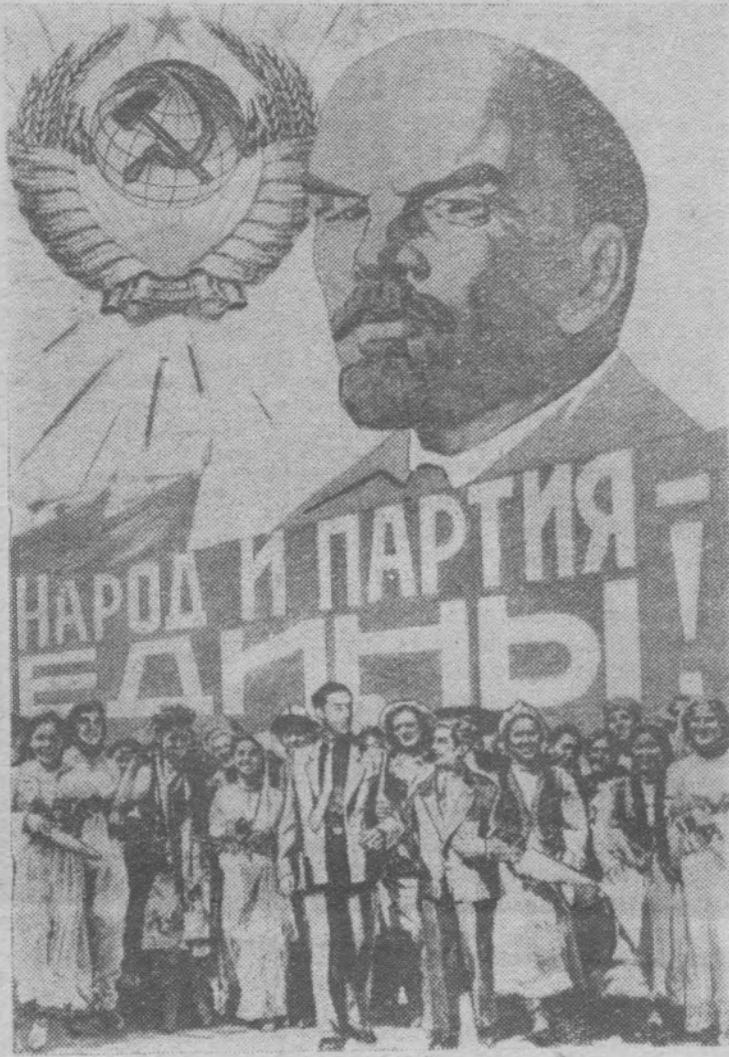
Фотоплакат художника Б. Антонова

С законной гордостью и восхищением видят советские люди замечательные плоды многообразной, неутомимой работы нашей партии—работы во имя блага и счастья каждого человека, всего нашего народа, всех народов мира. За последние годы партия и ее ленинский Центральный Комитет разработали и провели в жизнь важнейшие мероприятия, которые позволили еще стремительнее двинуть вперед развитие