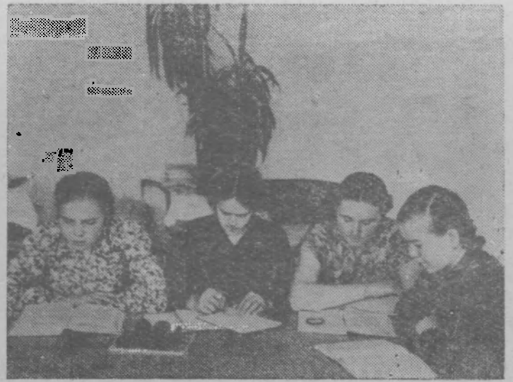
В читальном зале.

торговлю книгами надо частично перенести из специальных магазинов в клубы и сады. Надо организовать торговлю книгами, особенно в сельских клубах и других очагах культуры. А продавцами этих книг должны быть люди, знающие литературу, умеющие не только показать красивый переплет книг, а и рассказать о ее авторе, ее героях. В. Колпаков.