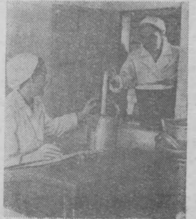
КОСТРОМСКАЯ ОБЛАСТЬ. Хорошую инициативу проявили доярки колхоза «Новый путь» Костромского района. Они организовали борьбу за чистоту и высокую санитарную культуру на фермах. За животными налажен тщательный уход с ежедневной чисткой. На снимке: У доярок колхоза «Новый путь»