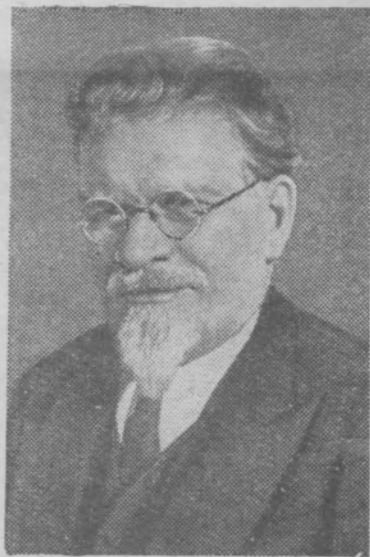
М. И. КАЛИНИН.

Сегодня исполняется 85 лет со дня рождения (1875) М. И. Калинина, выдающегося деятеля Коммунистической партии и Советского государства.