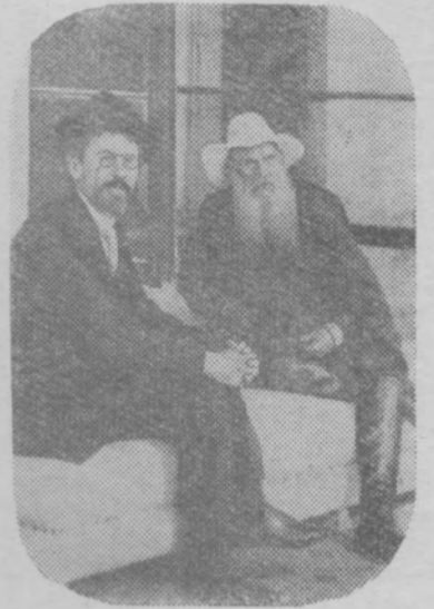
Л. Н. Толстой и А. П. Чехов.

Внезапная смерть оборвала полную исканий, рвущуюся вперед жизнь непокорного, метущегося великого человека и писателя. Произведения же его остались жить в веках, как