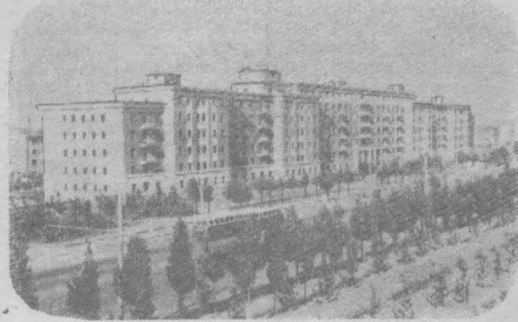
Китайская Народная Республика. Новый жилой дом в восточном пригороде Пекина.