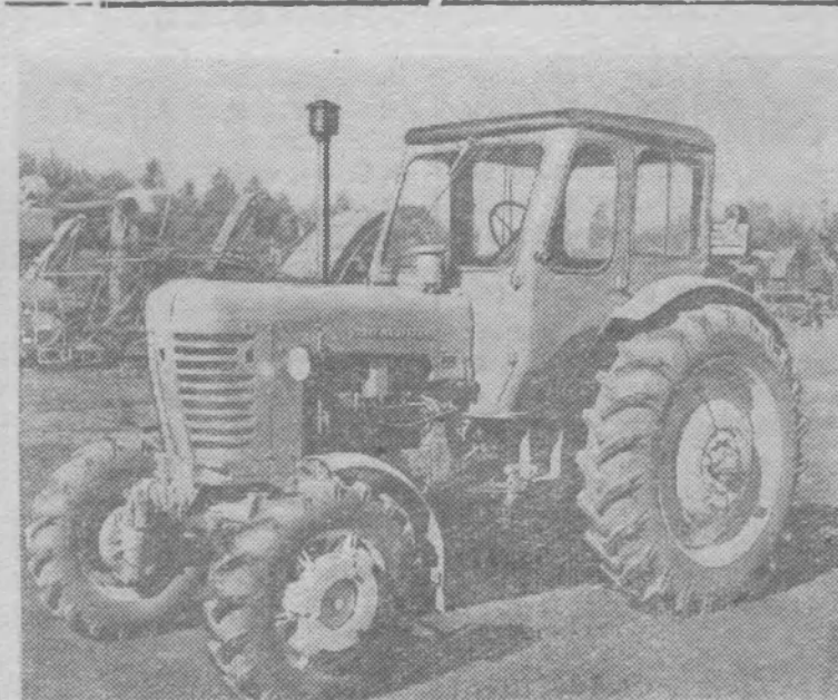
Краснодарский край. Кубанский научно-исследовательский институт испытаний тракторов и сельскохозяйственных машин проводит испытания современных машин и механизмов, созданных советскими конструкторами.

Собрание партийного актива приняло соответствующее решение.