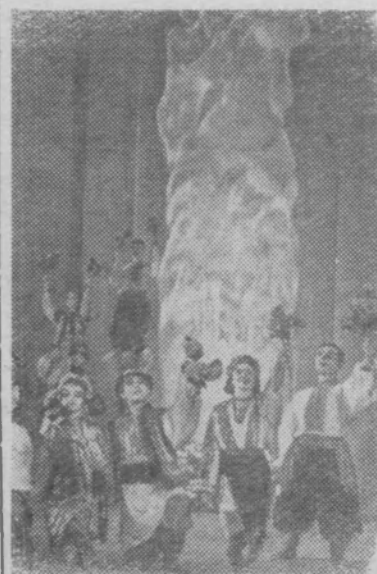
МОСКВА. 12 ноября в день открытия декады в помещении концертного зала имени П. И. Чайковского состоялся концерт Государственного заслуженного ансамбля танца УССР.

Организованно, на высоком политическом уровне провести выборы народных судов, внести достойный вклад в выполнение семилетнего плана, в дело дальнейшего подъема экономики и культуры нашего района—такова сегодняшняя задача партийных организаций, сельских и поселковых Советов, всех трудящихся!