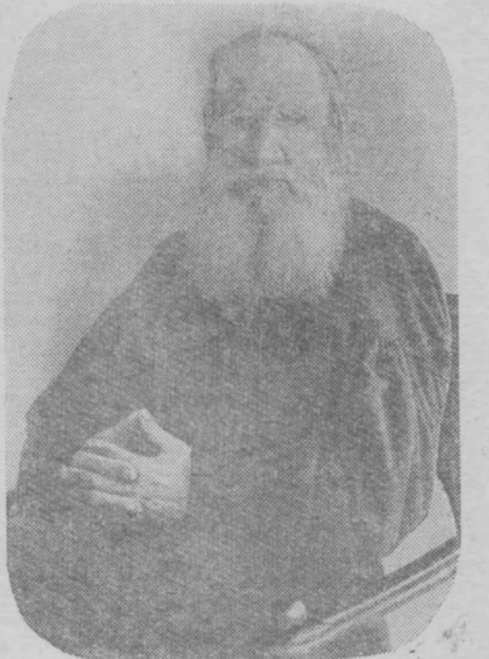
Л. Н. Толстой.