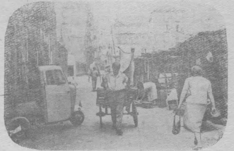
Италия. Неаполь. В этих районах живет беднота.

тинской Америки. В Чили, Аргентине и Бразилии 7 ноября бастовало в общей сложности свыше 3,5 миллиона трудящихся. Такого размаха забастовочного движения Латинская Америка еще не знала.