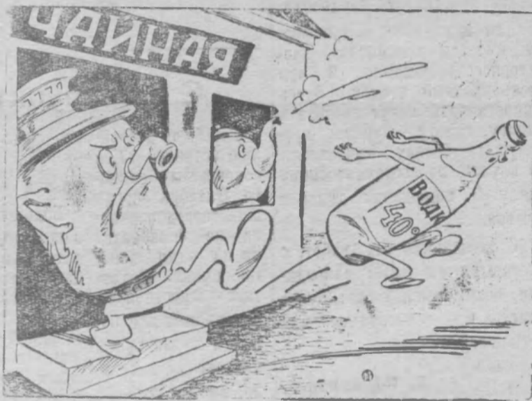
Удар от ворот.

Не пора ли бутылку с белой головкой вместе с ее любителями выпроводить из чайных? (Из писем рабкоров пос. Пижмы)