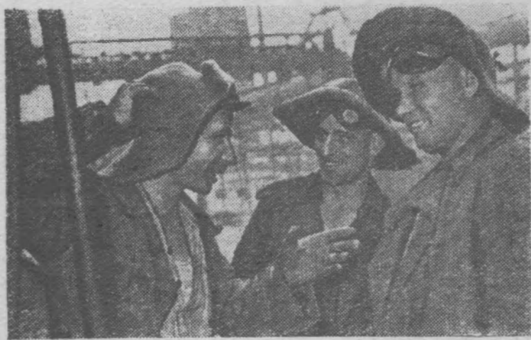
СТАЛИНСКАЯ ОБЛАСТЬ. Коксовому цеху Ждановского коксохимического завода присвоено звание цеха коммунистического труда. Коллектив выдал с начала года несколько тысяч тонн кокса сверх задания.

Многие читатели просят познакомиться их с розничными ценами на основные про-