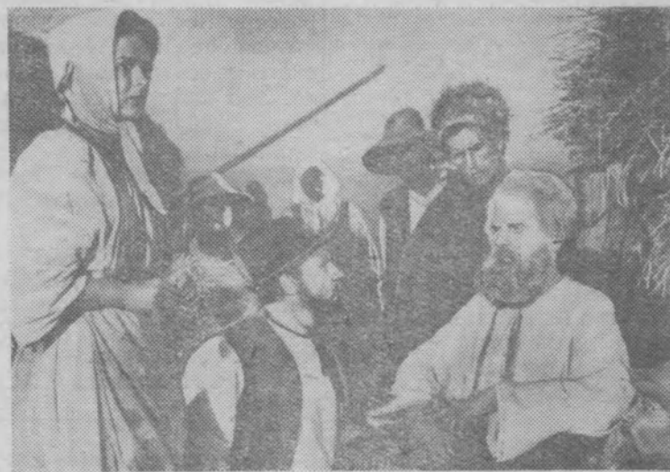
Кадр из нового художественного фильма «Таврия». Производство киностудии имени А. П. Довженко.