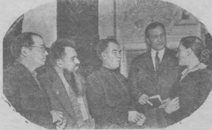
Москва. В Доме литераторов состоялась встреча писателей с председателями колхозов Московской и Рязанской областей.