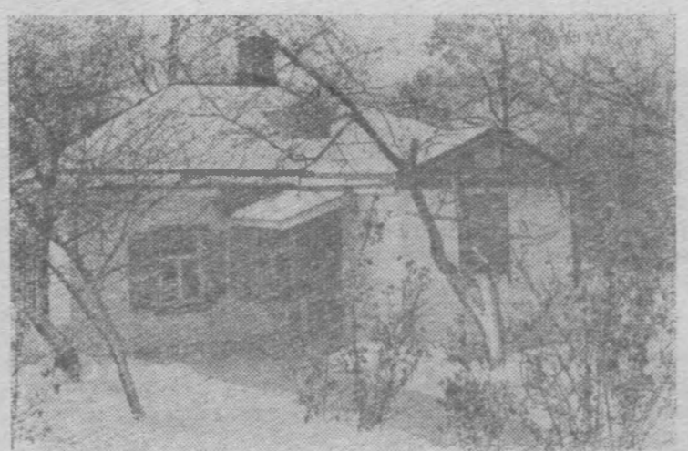
Дом в Таганроге, где родился А.П. Чехов. Ныне дом-музей А. П. Чехова.