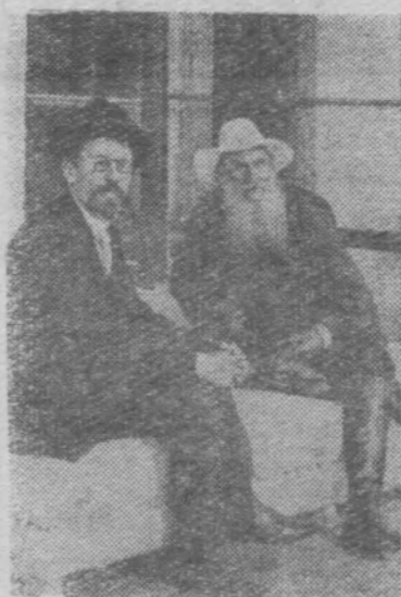
А. П. Чехов и Л. Н. Толстой (снимок 1902—1904 г.г.)