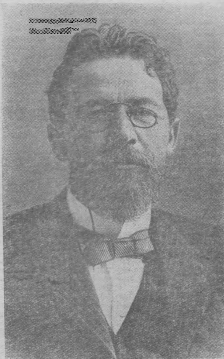
Антон Павлович ЧЕХОВ—великий русский писатель.

И. Петрова, кандидат филологической науки.