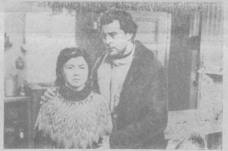
Кадр из датского художественного фильма „Легенда о беглеце“.