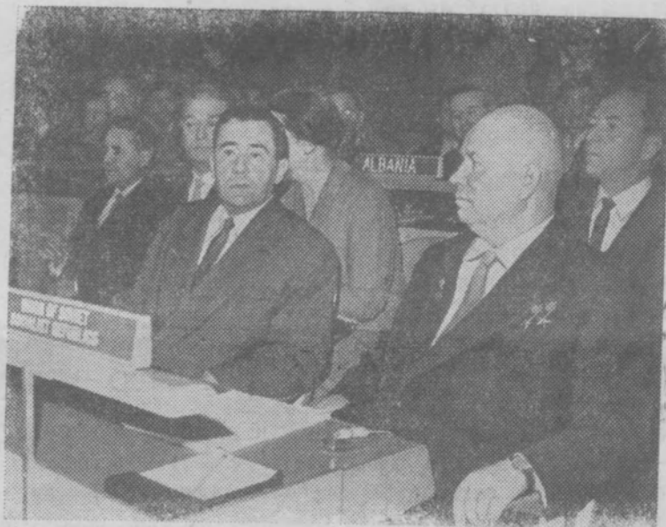
Нью-Йорк. XV сессия Генеральной Ассамблеи ООН.