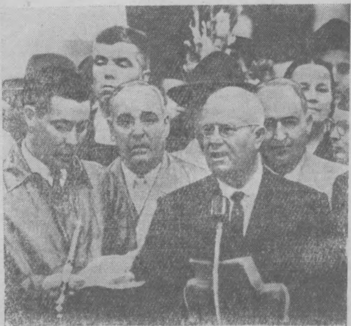
НЬЮ-ЙОРК. Н. С. Хрущев выступает с заявлением для представителей американской, советской и иностранной прессы, радио и телевидения. Справа налево: товарищи Тодор Живков, Н. С. Хрущев и Г. Георгиу-Деж.

Год издания 26-ой СУББОТА, 24 сентября 1960 года № 115 Цена 15 коп.