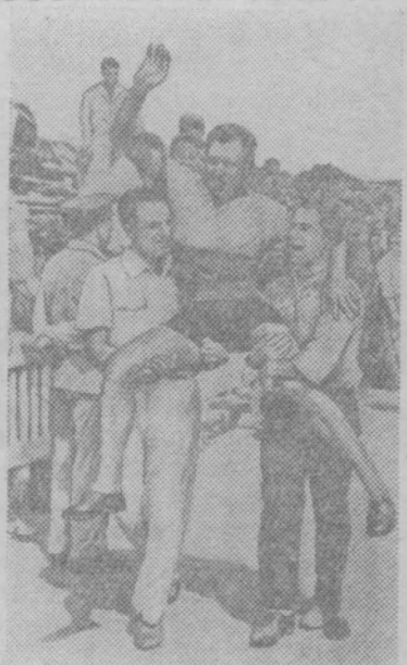
Новый успех принес советской олимпийской команде москвич Виктор Капитонов (ЦСКА).

На снимке: Виктора Капитонова после победы в шоссейной гонке несут на руках его тренеры.