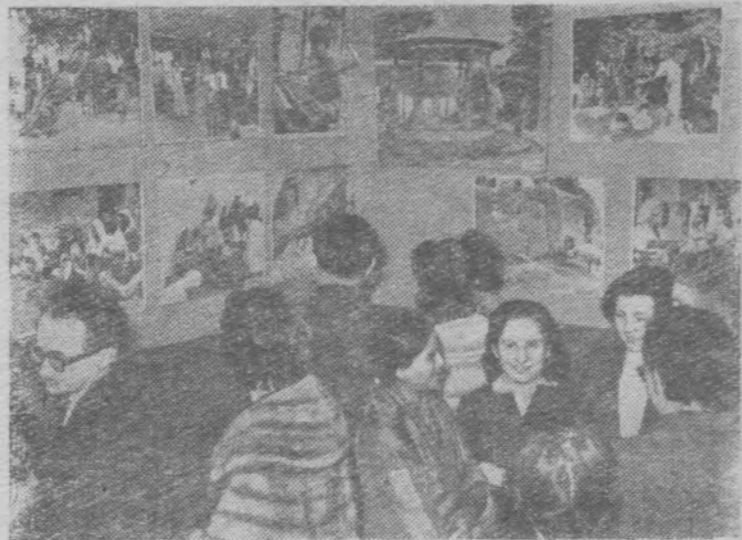
Москва. В Деле дружбы с народами зарубежных стран открылась фотографическая выставка «Заботы о женщинах и детях Индии». Выставка подготовлена Всесоюзным советом общественного благосостояния.

На снимке: на выставке.