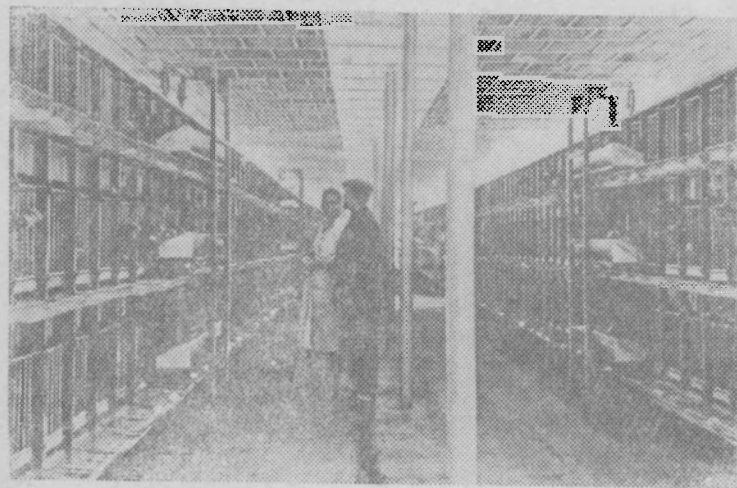
Чехословацкая Республика. Птицеферма госхоза Стадце. Несушки здесь содержатся в специальных клетках.