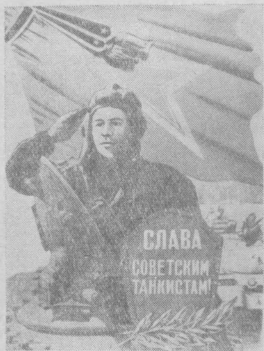
Плакат Б. Антонова.

Четырнадцатый год, в ознаменование выдающихся заслуг советских танкистов в Великой Отечественной войне, отмечает наш народ День танкистов.