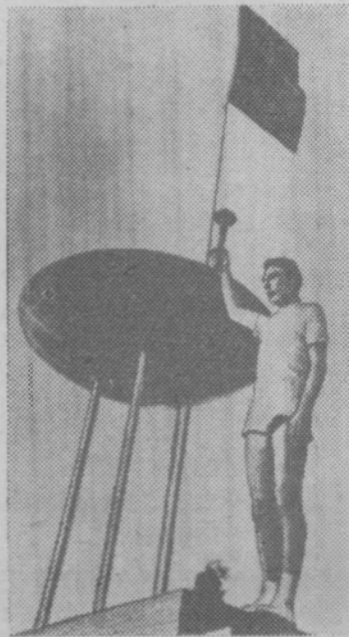
Рим. Церемония открытия XVII Олимпийских игр.

Ференц Немет (Венгрия) стал обладателем золотой медали в соревнованиях по современному пятиборью. Командное первенство по этому виду спорта выиграла команда Венгрии, на втором месте — команда Советского Союза, на третьем — США. В личном зачете советский спортсмен Новиков занял пятое место. (ТАСС).