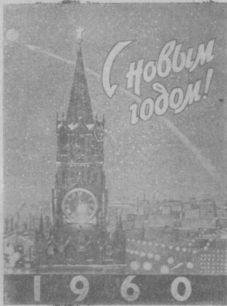
Фотомонтаж художника А. Перельмана.